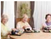
老人ホームなどの 介護施設