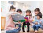
幼稚園・保育園などの 児童施設