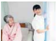
病院など医療施設